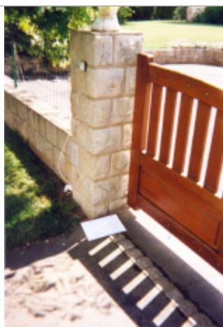
Photographie du repère