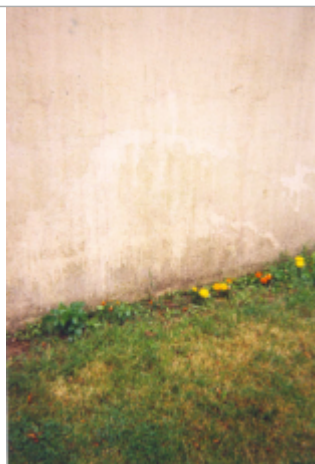
Photographie du repère ( 19/01/2001 )

Altitude calculée de l'eau (en m) : 13.02 m