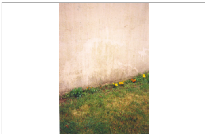
Photographie du repère ( 19/01/2001 )

Altitude calculée de l'eau (en m) : 13.02 m