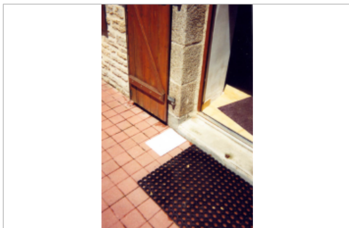
entrée à l'avant de la maison

Altitude calculée de l'eau (en m) : 12.42