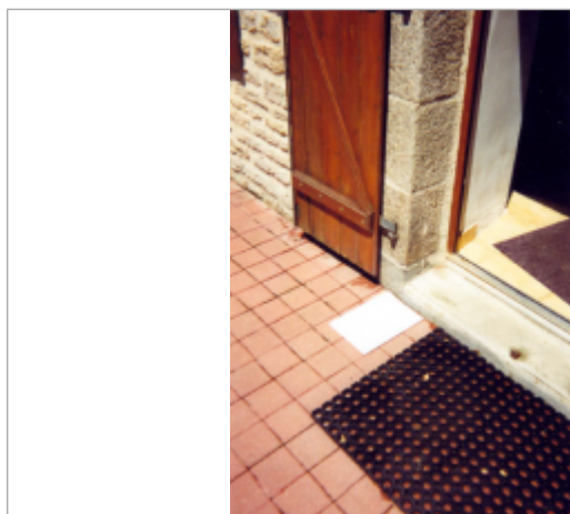
Photographie du repère ( 19/01/2001 )