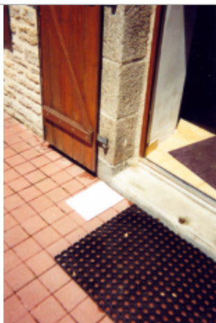
entrée à l'avant de la maison

Altitude calculée de l'eau (en m) : 12.42