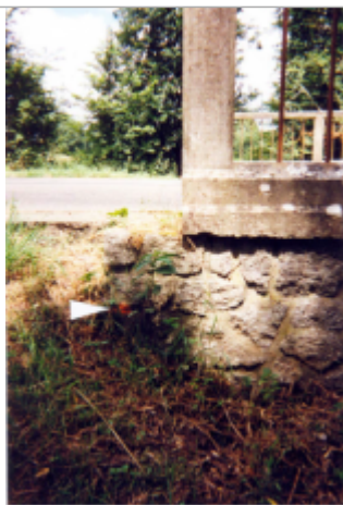
Photographie du repère ( 19/01/2001 )

Altitude calculée de l'eau (en m) : 12.63