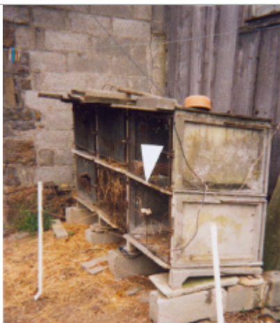
Photographie du repère ( 19/01/2001 )

Altitude calculée de l'eau (en m) : 12.83 m