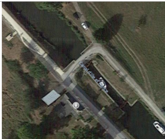
Ecluse de la Roche

Coordonnées WGS84 : X: -1.99576260 / Y: 48.38492280