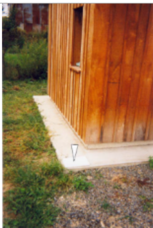
Photographie du repère ( 19/01/2001 )

Altitude calculée de l'eau (en m) : 11.61 m