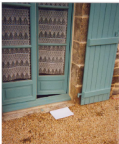
Photographie du repère ( 19/01/2001 )

Altitude calculée de l'eau (en m) : 11.66 m