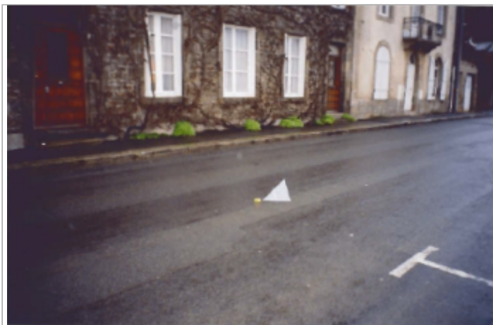
Vue de la route devant le site (19/01/2001)