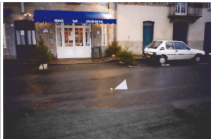
Vue de la route devant 57 rue du Quai (19/01/2001)

Coordonnées WGS84 : X: -2.03627890 / Y: 48.45907100