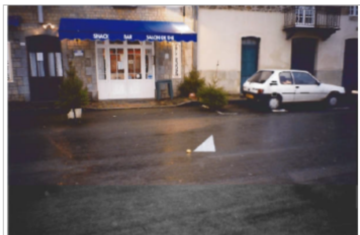
Photographie du repère ( 19/01/2001 )

Altitude calculée de l'eau (en m) : 7.68 m