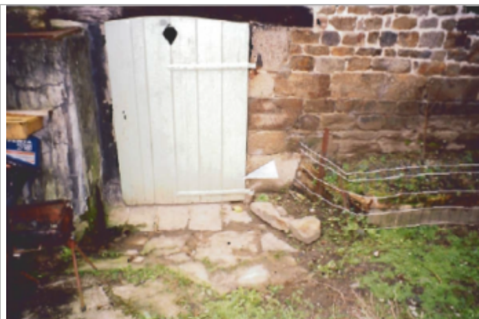
Vue d'ensemble du site (19/01/2001)