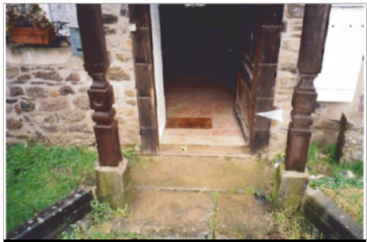
Photographie du repère ( 19/01/2001 )

GÉNÉRAL Code : SPC VCB 22100-012a Date de mise à jour : 15/07/2021 Auteur : SPC VCB