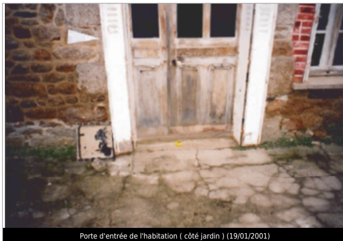
Porte d'entrée de l'habitation ( côté jardin ) ( 19/01/2001 )