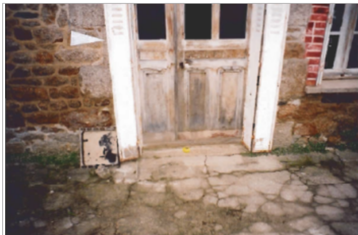
Porte d'entrée de l'habitation ( côté jardin ) (19/01/2001)