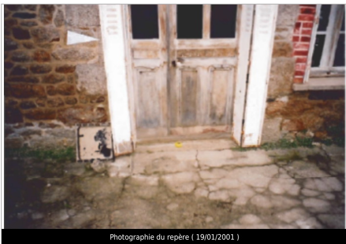
Photographie du repère ( 19/01/2001 )

Altitude calculée de l'eau (en m) : 9.92 m