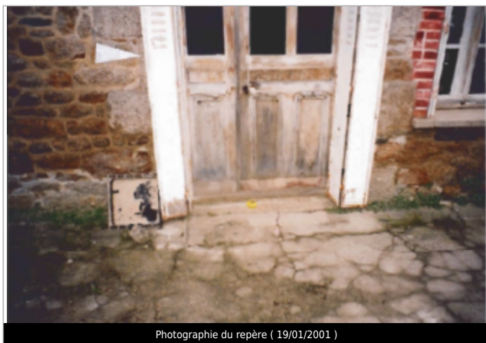
Photographie du repère ( 19/01/2001 )

Altitude calculée de l'eau (en m) : 9.92