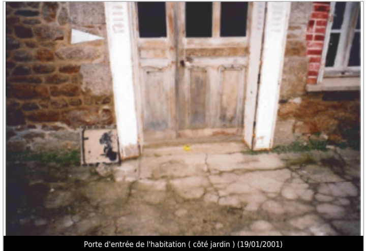
Porte d'entrée de l'habitation ( côté jardin ) (19/01/2001)