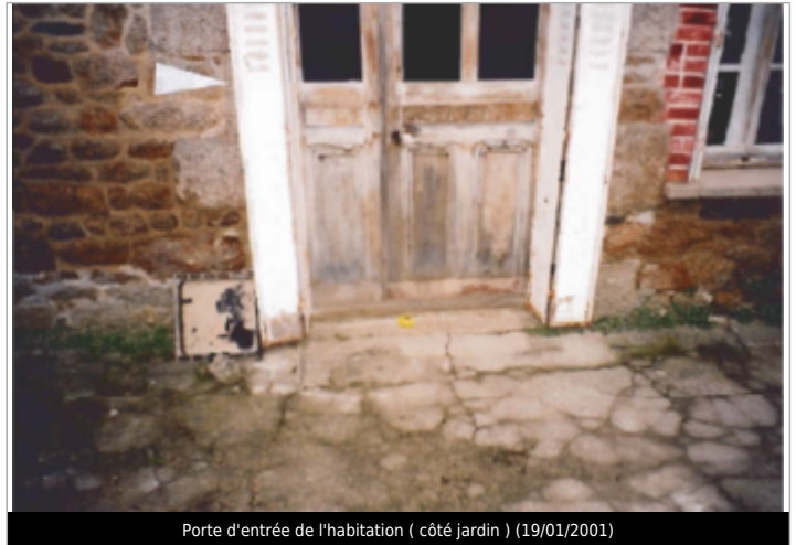
Porte d'entrée de l'habitation ( côté jardin ) (19/01/2001)