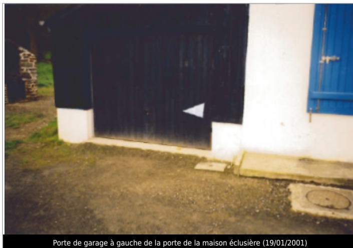
Porte de garage à gauche de la porte de la maison éclusière (19/01/2001)