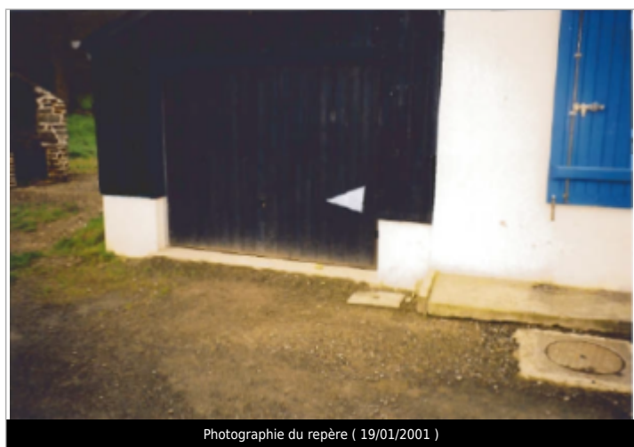
Photographie du repère ( 19/01/2001 )

Code : SPC VCB 22100-007b Date de mise à jour : 19/03/2020 Auteur : SPC VCB