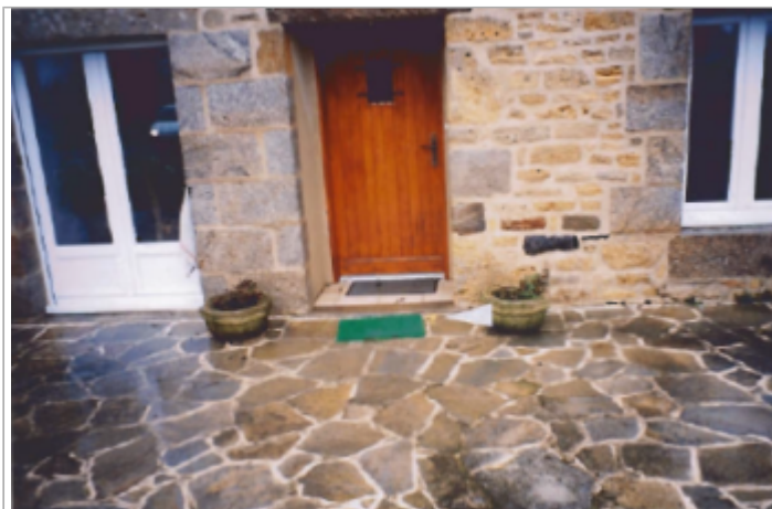
Porte d'entrée de l'habitation ( 19/01/2001)