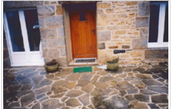
Porte d'entrée de l'habitation ( 19/01/2001 )