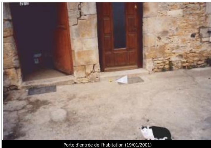
Porte d'entrée de l'habitation (19/01/2001)