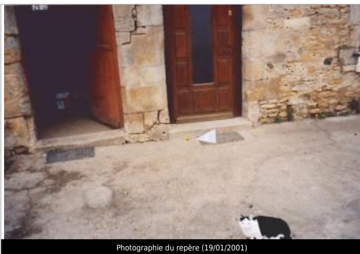
Photographie du repère (19/01/2001)

Altitude calculée de l'eau (en m) : 15.25 m