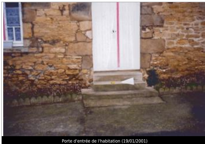
Porte d'entrée de l'habitation (19/01/2001)