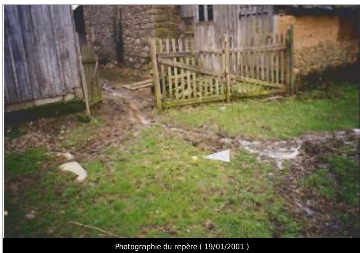
Photographie du repère ( 19/01/2001 )

Code : SPC VCB 22350-008a Date de mise à jour : 15/07/2021 Auteur : SPC VCB