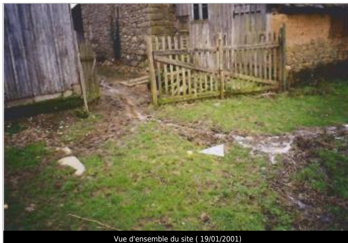
Vue d'ensemble du site ( 19/01/2001 )