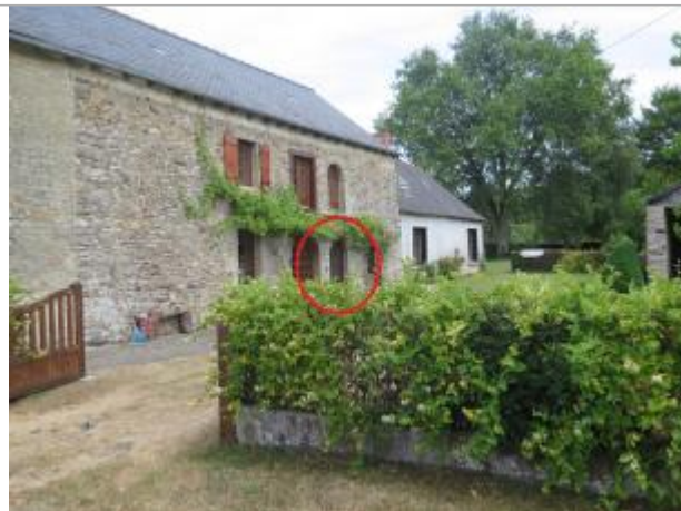
Vue d'ensemble du site ( 17/07/2019)