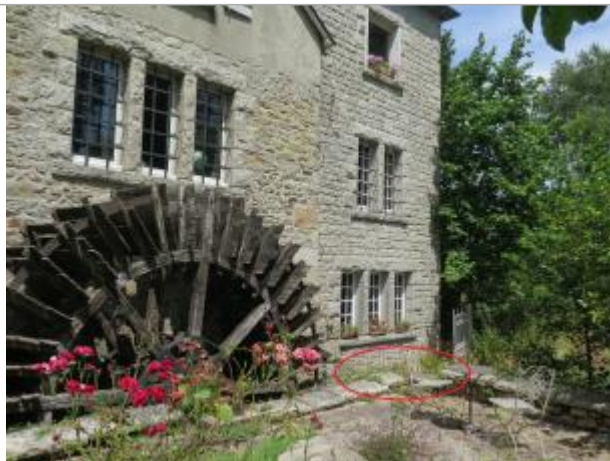
Vue d'ensemble du site ( 17/07/2019)