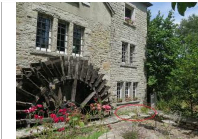
Vue d'ensemble du site ( 17/07/2019 )