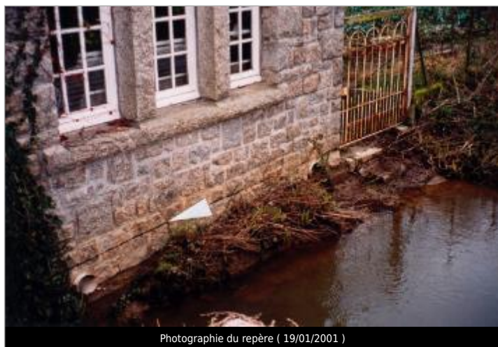
Photographie du repère ( 19/01/2001 )

SOURCE DE REPÉRAGE : CAMPAGNE ATLAS ZONE INONDABLE 2001 - 06/07/2019