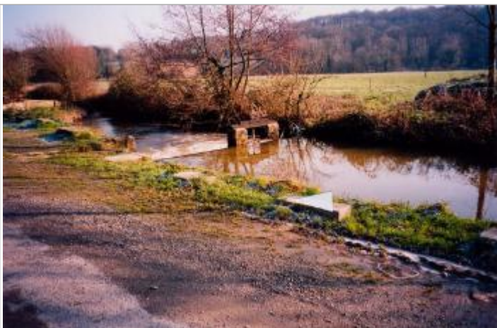
Photographie du repère ( 19/01/2001 )

Altitude calculée de l'eau (en m) : 53.29 m