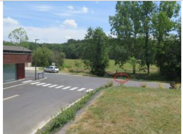
Vue d'ensemble du site ( 17/07/2019 )