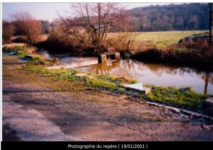
Photographie du repère ( 19/01/2001 )

Altitude calculée de l'eau (en m) : 53.29