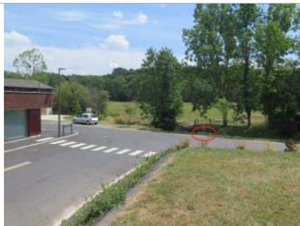
Vue d'ensemble du site ( 17/07/2019)