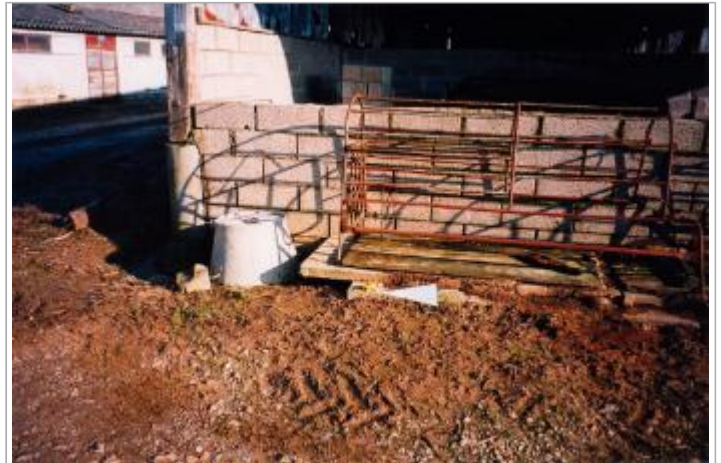
Photographie de l'arrière du hangar (19/01/2001)