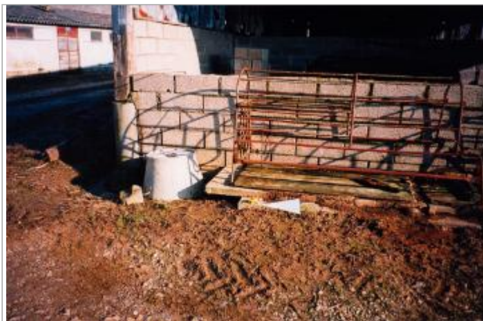
Photographie de l'arrière du hangar (19/01/2001)