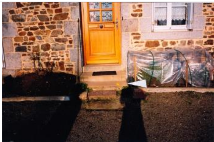
Photographie du repère ( 19/01/2001 )

Altitude calculée de l'eau (en m) : 60.14 m