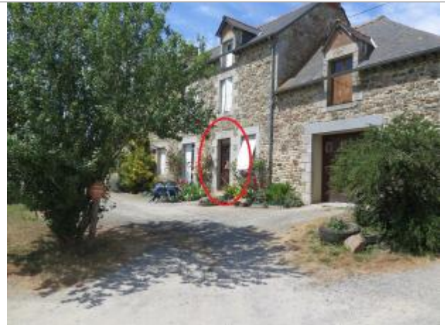
Vue d'ensemble du site ( 17/07/2019)

Coordonnées WGS84 : X: -2.15404430 / Y: 48.26501300