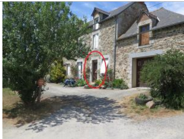
Vue d'ensemble du site ( 17/07/2019)