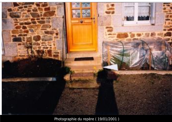
Photographie du repère ( 19/01/2001 )

Altitude calculée de l'eau (en m) : 60.14