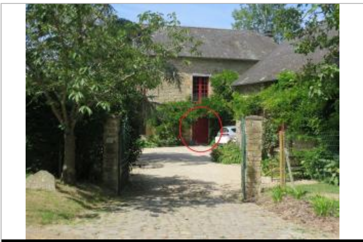
Vue d'ensemble du site ( 17/07/2019)

GÉOLOCALISATION Coordonnées WGS84 : X: -2.17062630 / Y: 48.25256200 Coordonnées RGF93 (Lambert 93) X: 316488.95 / Y: 6807252.29 Coordonnées RGF93 (ETRS89) : X: -2.1706263 / Y: 48.252562 Code Hydro: J0--0160 Rive de référence: Droite