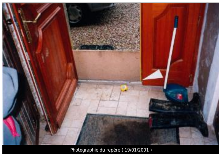
Photographie du repère ( 19/01/2001 )

SOURCE DE REPÉRAGE : CAMPAGNE ATLAS ZONE INONDABLE 2001 - 06/07/2019