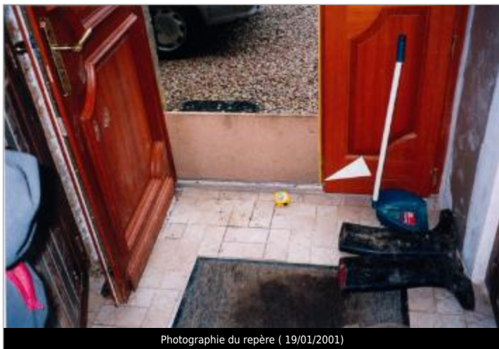
Photographie du repère ( 19/01/2001)

SOURCE DE REPÉRAGE : CAMPAGNE ATLAS ZONE INONDABLE 2001 - 06/07/2019