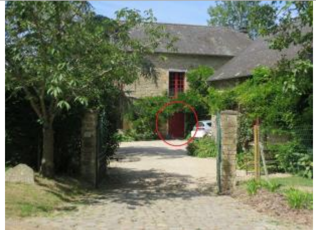
Vue d'ensemble du site ( 17/07/2019)