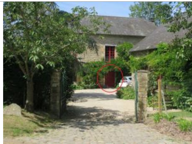
Vue d'ensemble du site ( 17/07/2019 )