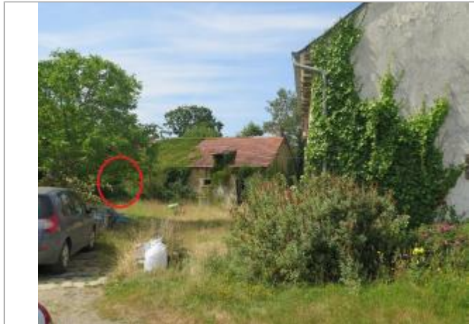
Vue d'ensemble du site ( 17/07/2019)

Coordonnées WGS84 : X: -2.18536030 / Y: 48.24942300