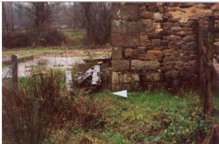
Photographie du repère ( 19/01/2001 )

Altitude calculée de l'eau (en m) : 65.81 m