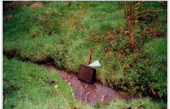
Photographie de la fosse (19/01/2001)

Coordonnées WGS84 : X: -2.23380860 / Y: 48.25778800