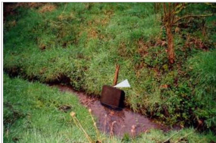
Photographie de la fosse (19/01/2001)