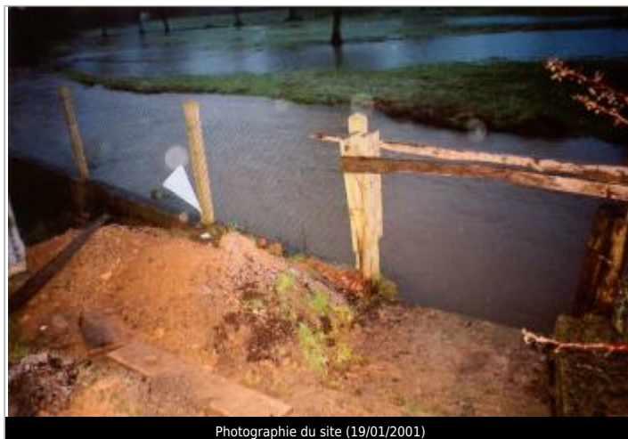
Photographie du site (19/01/2001)