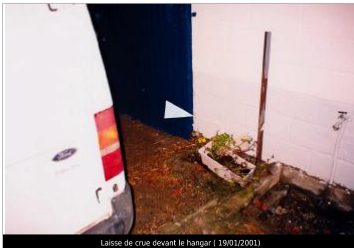
Laisse de crue devant le hangar ( 19/01/2001)

Coordonnées WGS84 : X: -2.29421530 / Y: 48.25340500