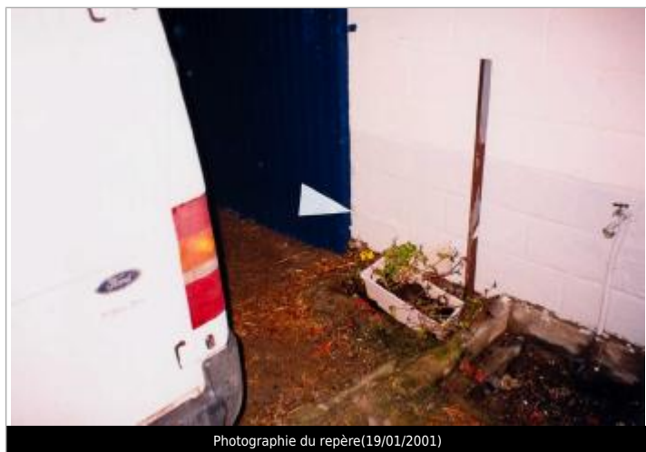
Photographie du repère(19/01/2001)

Altitude calculée de l'eau (en m) : 94.71