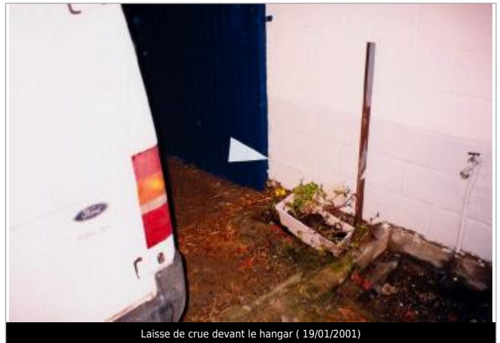
Laisse de crue devant le hangar ( 19/01/2001)

Coordonnées WGS84 : X: -2.29421530 / Y: 48.25340500