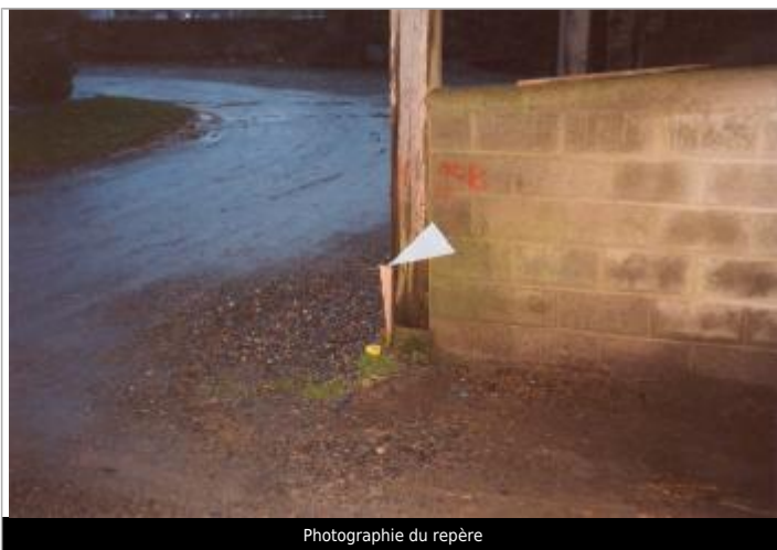
Photographie du repère

Altitude calculée de l'eau (en m) : 94.92