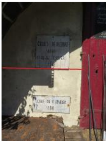
Photographie du repère

Altitude calculée de l'eau (en m) : 10.78 m