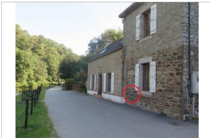
Vue d'ensemble de la façade de la maison d'écluse