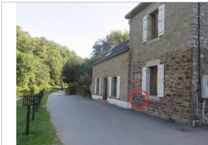
Vue d'ensemble de la façade de la maison d'écluse