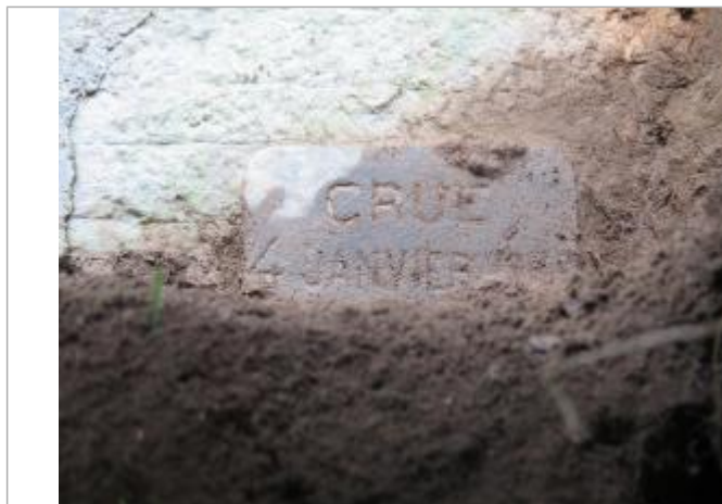
Photographie du repère

Système altimétrique : NGF IGN 1969 (système normal)