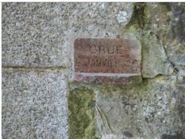
Photographie du repère

Système altimétrique : NGF IGN 1969 (système normal)