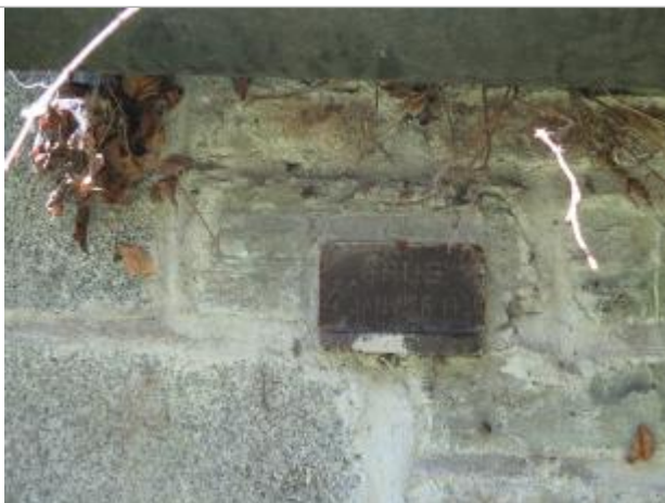
Photographie du repère

Système altimétrique : NGF IGN 1969 (système normal)