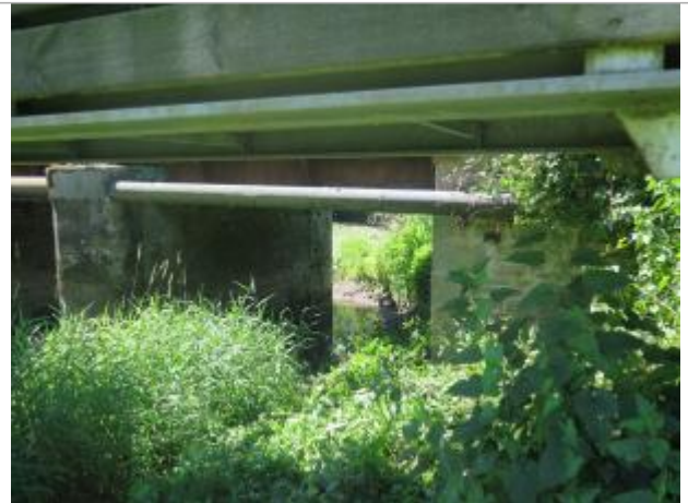
Vue du dessous du pont