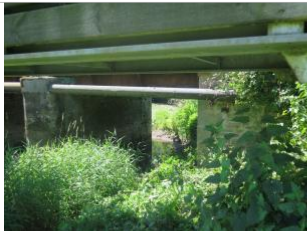
Vue du dessous du pont