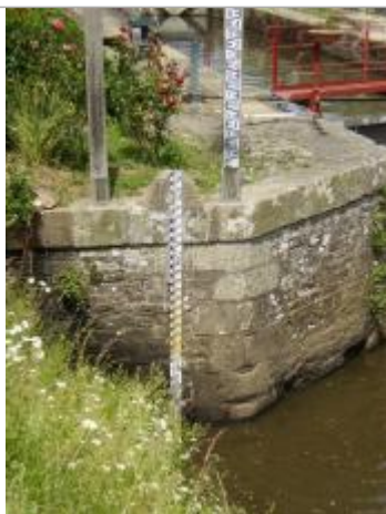
Echelle limnimétrique à l'aval de l'écluse de La Bouexière à Guichen

Altitude calculée de l'eau (en m) : 14.986 m