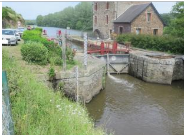
Aval de l'écluse de La Bouexière à Guichen

Coordonnées WGS84 : X: -1.75184440 / Y: 47.94560890