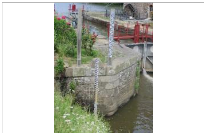
Echelle limnimétrique à l'aval de l'écluse de La Bouexière à Guichen

Altitude calculée de l'eau (en m) : 14.986 m