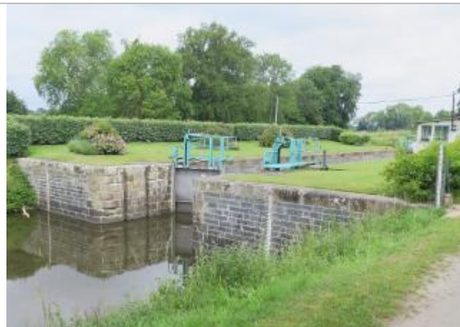
Vue générale de l'aval de l'écluse de Mons à Bruz

Coordonnées WGS84 : X: -1.77295990 / Y: 48.02695380