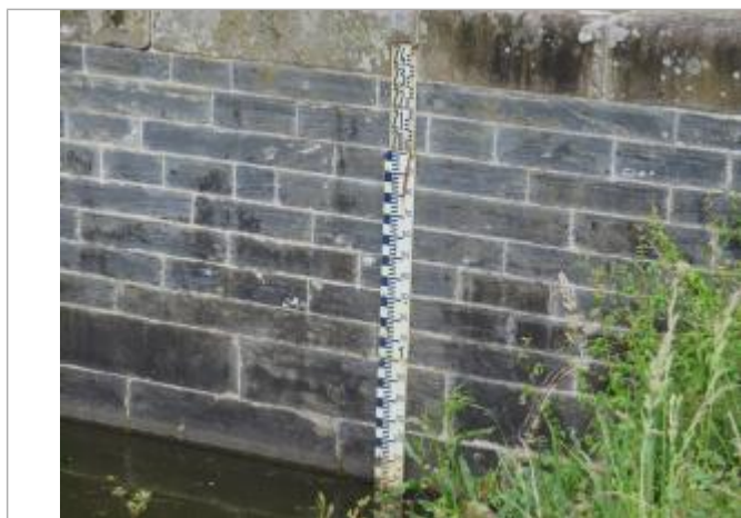
Echelle limnimétrique n°1 à l'aval de l'écluse de Mons à Bruz

Altitude calculée de l'eau (en m) : 19.069 m