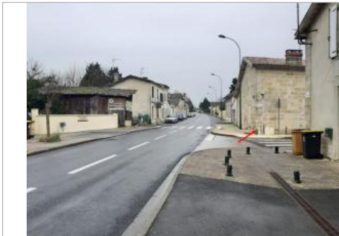
Vue du site - Auteur : EPIDOR

Coordonnées WGS84 : X: -0.14340450 / Y: 45.03617320