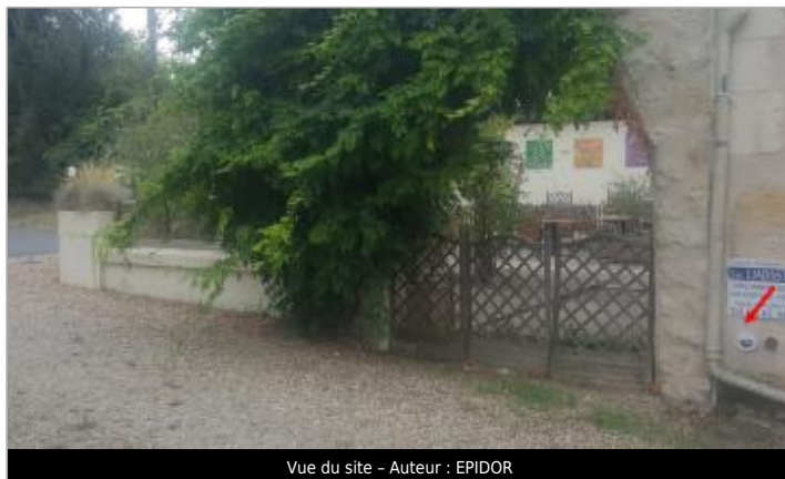
Vue du site - Auteur : EPIDOR