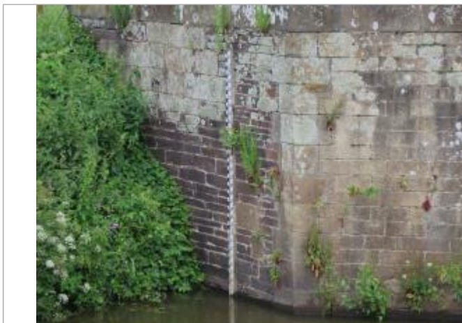
Echelle limnimétrique à l'aval de l'écluse de Cicé à Bruz

Altitude calculée de l'eau (en m) : 20.202 m