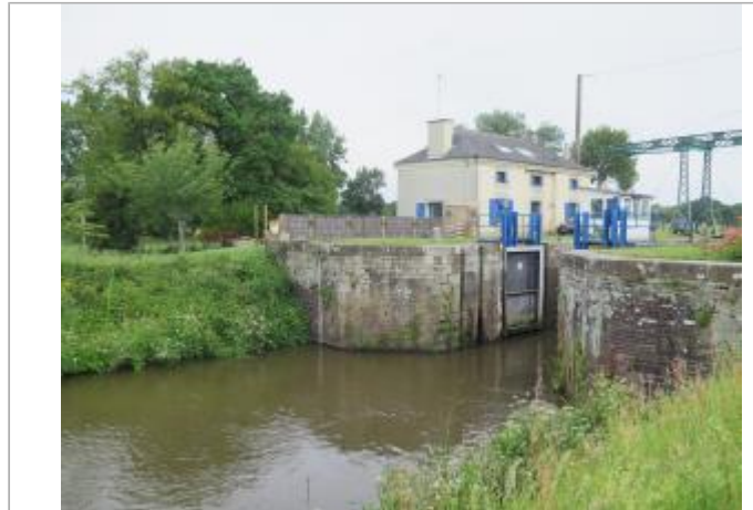
Vue générale de l'aval de l'écluse de Cicé à Bruz

Coordonnées WGS84 : X: -1.76689160 / Y: 48.05081320