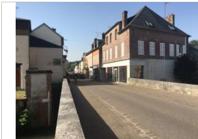
Vue de l'échelle depuis le pont