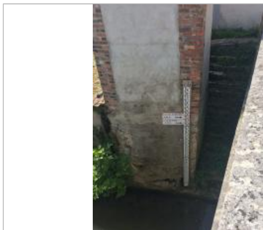
Crue de mai 2016

Altitude calculée de l'eau (en m) : 112.66