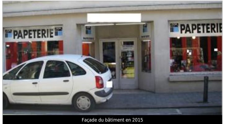
Façade du bâtiment en 2015