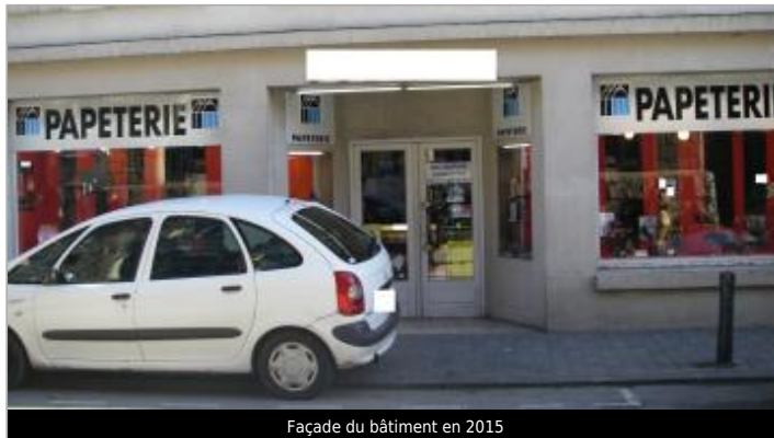
Façade du bâtiment en 2015