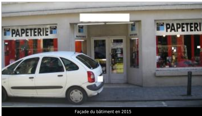
Façade du bâtiment en 2015

GÉOLOCALISATION Coordonnées WGS84 : X: -3.82836170 / Y: 48.57637400 Coordonnées RGF93 (Lambert 93) X: 196910.88 / Y: 6852450.5 Coordonnées RGF93 (ETRS89) : X: -3.8283617 / Y: 48.576374 Code Hydro: J2614000 Rive de référence: Gauche