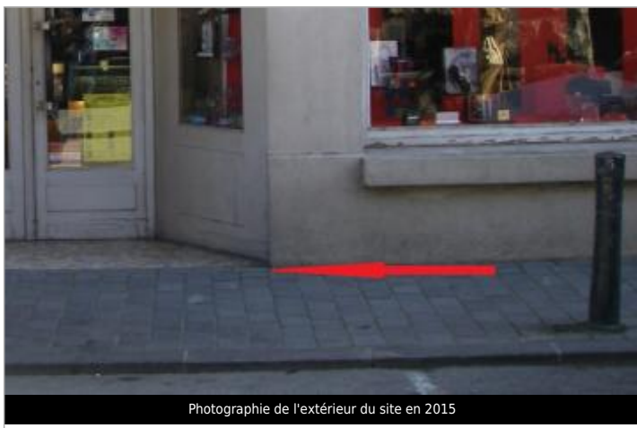
Photographie de l'extérieur du site en 2015

Type de repérage : Campagne de terrain post-inondation