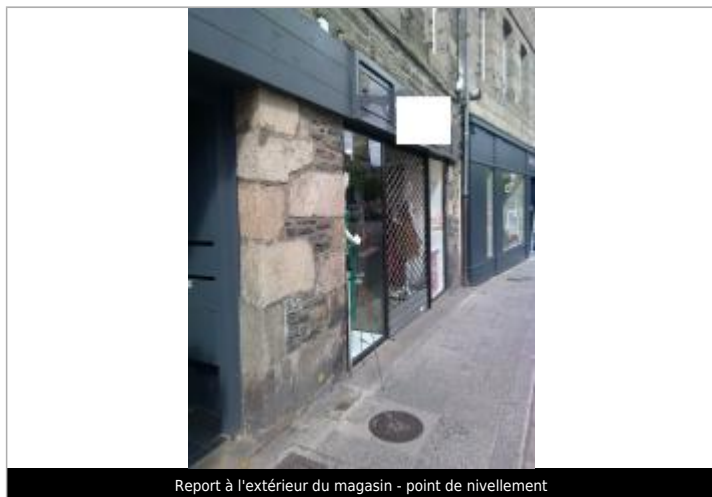
Report à l'extérieur du magasin - point de nivellement

Altitude calculée de l'eau (en m) : 6.06