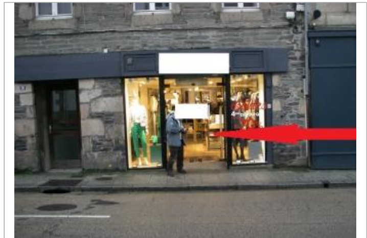
Devanture du bâtiment de commerce