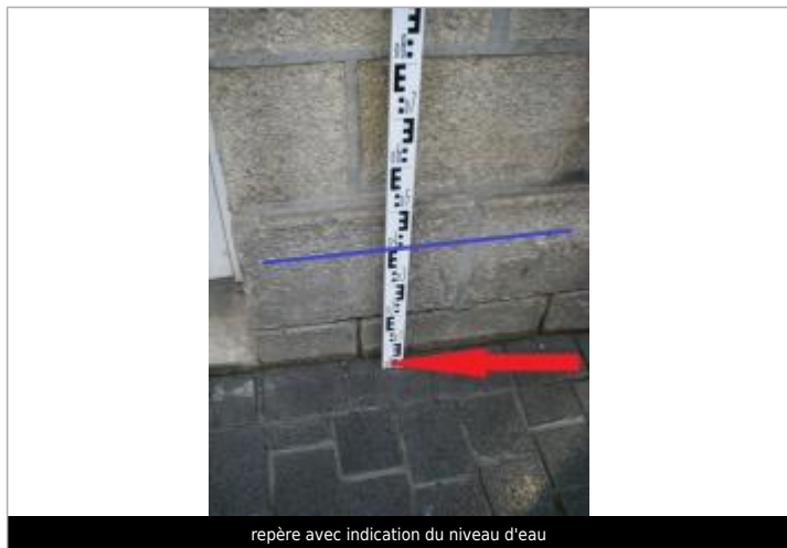
repère avec indication du niveau d'eau

Altitude calculée de l'eau (en m) : 8.05 m