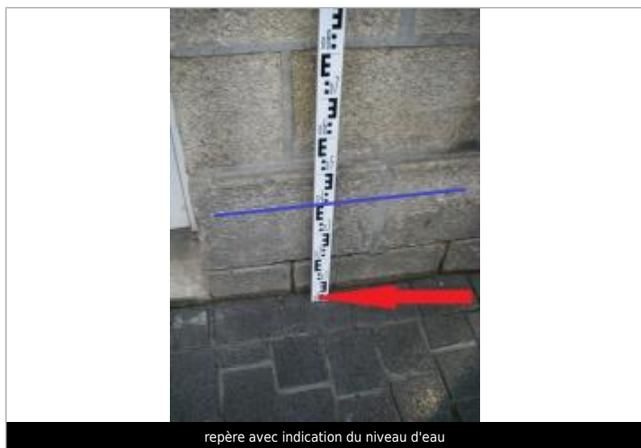
repère avec indication du niveau d'eau

Altitude calculée de l'eau (en m) : 8.05